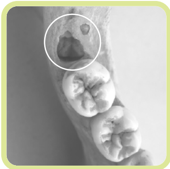
Weisheitszahn des Unterkiefers im Zahnfach hinter dem zweiten Backenzahn.